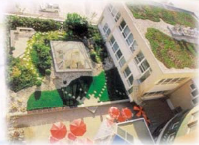
Bratislava Business Center Slovakia Diseño J. Brabac