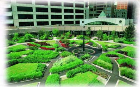
Parque del Puerto Darling Sydney, Australia

Una cubierta vegetal se trata de un jardín ubicado en un lugar poco común, a menudo poco accesible y en el que las plantas no tienen acceso a un suelo nutritivo. Las plantas ubicadas en techos, balcones (macetas) y paredes (fachadas vegetales) se enfrentan a menudo con problemas de bajo volumen de sustrato y por ello necesitan una aportación grande de agua y nutrientes.