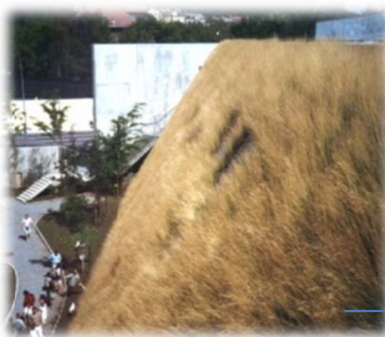
Siete meses más tarde