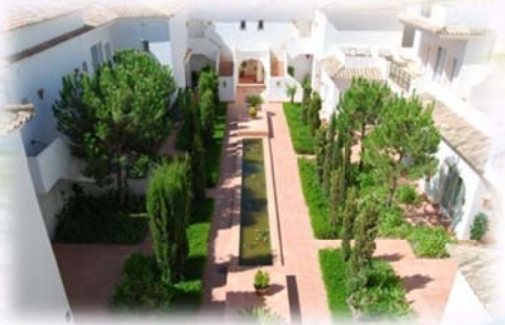
Fairplay Golf Hotel & Spa Benalup, España (2009)