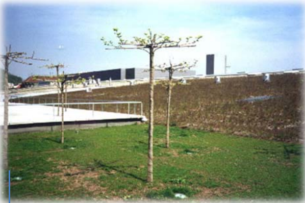
Primera primavera después de la plantación (03/2001)

Profundidad de la zona radicular: 10 cm; dosificación: 500 gr TC por m 3