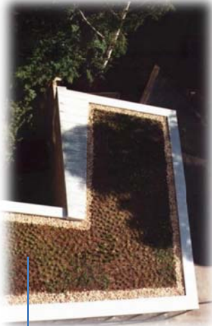
Justo después de la finalización (Profundidad de zona radicular: 20 cm)