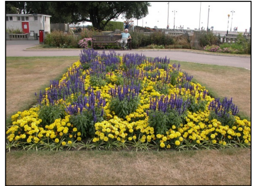
(à gauche: parterre H1 traité avec de TCC®, à droite: parterre H, contrôle)