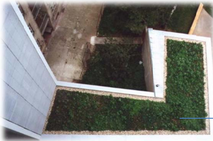
6 weken na aanleg