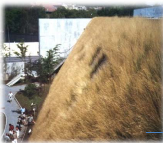
7 maanden later

TerraCottem® Universal Meer groei, minder water www.terracottem.com