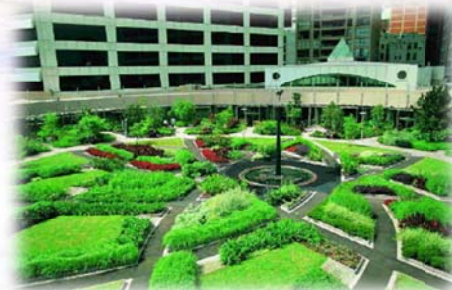
Darling Harbour Park Sydney, Australië

Een daktuin is meestal een tuin op een ongewone plaats, met beperkte toegang en waar de planten verstoten zijn van een rijke voedingsbodem. Deze planten op groendaken, balkons en groene gevels dienen namelijk te groeien in een beperkt bodemvolume, onderhevig aan extreme omstandigheden (temperatuur, droogte, wind, ...) en vereisen een substantiële input aan water en voedingsstoffen.