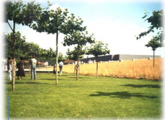
7 maanden later (06/2002)