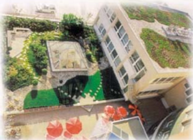
Bratislava Business Center Slovakië J. Brabac design