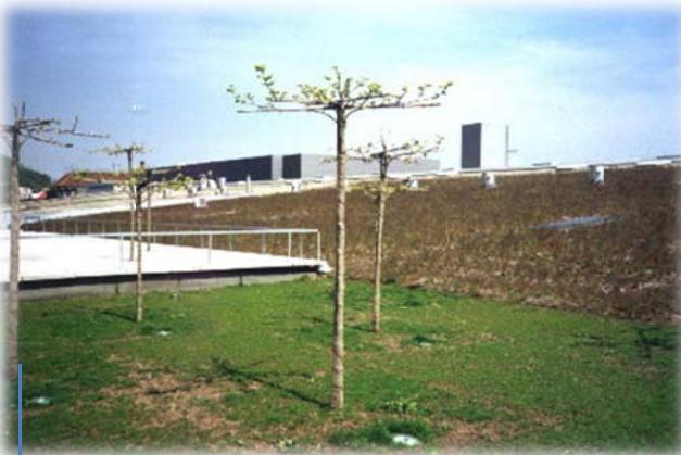
Eerste lente na aanplanting (03/2001)

Diepte wortelzone: 10cm; Dosis: 500g TC per m 3