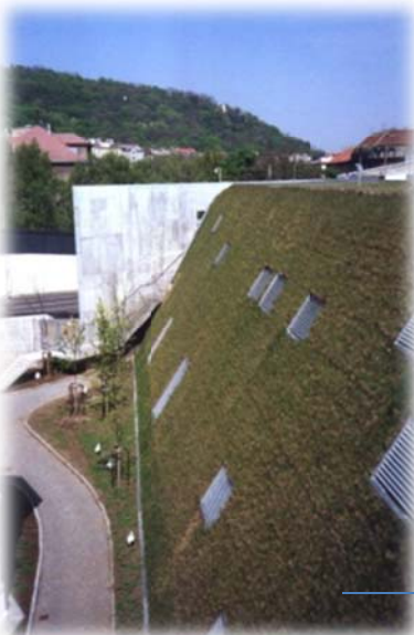
Muur, eerste lente na aanleg