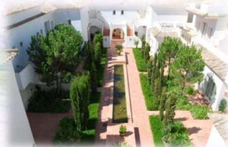
Fairplay Golf Hotel & Spa Benalup, Spanje (2009)